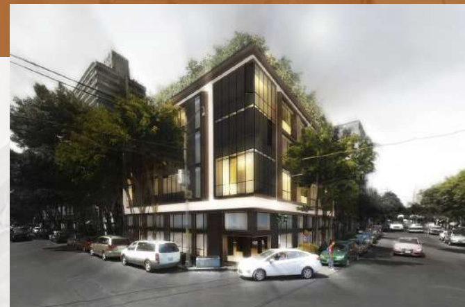
Hotel Lerma (render) Remodelacion / Comercial