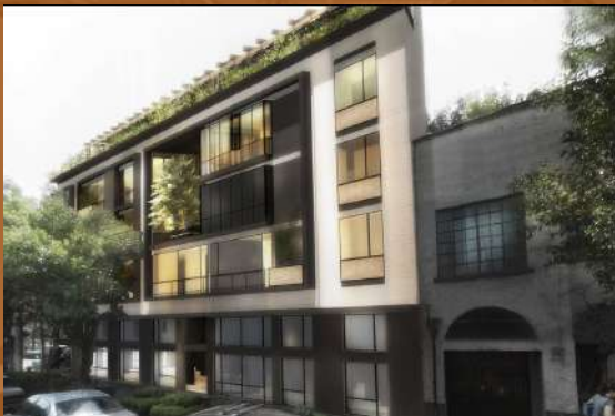
Hotel Lerma Remodelación / Comercial