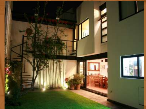
Residencia Zamora CDMX Construcción / Residencial