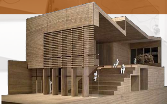
Modelo en madera