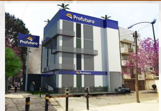
Plaza Profuturo CDMX Construcción / Corporativo