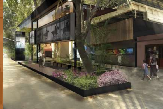
Cineteca Nacional CDMX Remodelación / Comercial