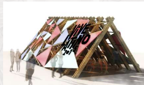
Vive Latino 2015 CDMX Construcción / Efímero