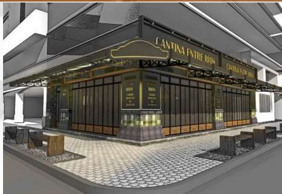
Cantina Entre Ríos CDMX Remodelación / Comercial