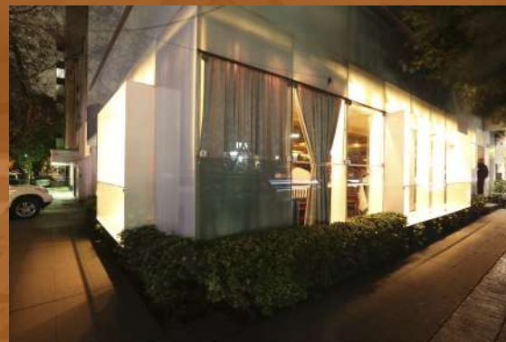
Xampa Bar CDMX Construcción / Comercial