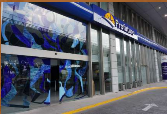
Corporativo Profuturo CDMX Remodelación / Corporativo