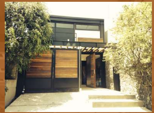
Residencia Pedregal CDMX Remodelación / Residencial